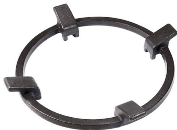
Support de Wok en fonte 9601 727