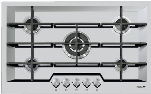
Table de cuisson KE